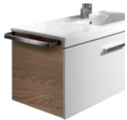
Toallero lateral para mueble