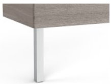
Conjunto de dos patas opcionales