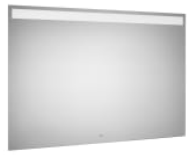
Espejo con luz superior