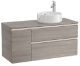
Mueble base de dos cajones para lavabo de sobre encimera derecha